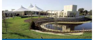
SAINT PETERSBURG FLORIDA