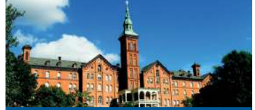
RIVERDALE, NEW YORK