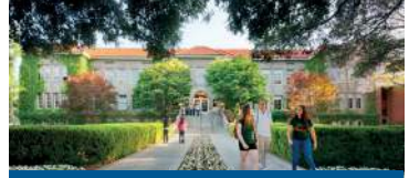
LA VERNE, CALIFORNIA